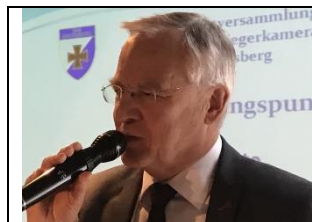
Walter Brilmayer 1. Bürgermeister