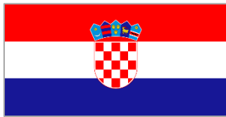
Flagge von Kroatien