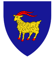
Wappen von Istrien

Istrien liegt im Norden Kroatiens mit einer herrlichen Inselwelt, mittelalterliche Städte und ein mildes, mediterranes Klima, kristallklares Wasser, traumhafte Badebuchten, idyllische Küstenstädte, unzählige Sehenswürdigkeiten, eine intakte Natur und die weit über die Landesgrenzen hinaus bekannte Gastfreundlichkeit der Einheimischen, die Urlauber Jahr für Jahr in ihren Bann zieht. Doch lassen Sie sich am besten selbst überzeugen und verzaubern, indem Sie die Schönheit der beliebtesten Urlaubsregion Kroatiens entdecken.