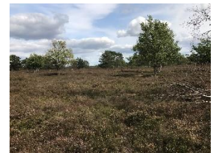
In der Lüneburger Heide