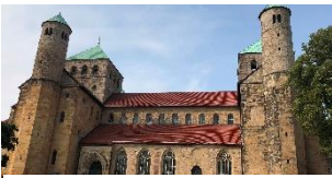
Mariendom in Hildesheim

Mittwoch, 29.08.2018: Abfahrt 05:50 Aßling, 06:00 Uhr Grafing, 06:20 Uhr Ebersberg Realschule, 06:30 Uhr Ebersberg Volksfestplatz Die Anfahrt führte über die Autobahn Nürnberg (Kaffeepause von 08:30 Uhr bis 09:20 Uhr), vorbei an Würzburg, (Mittagspause in der Rastanlage Großenmoor von 12:00 Uhr bis 12:45 Uhr) und weiter vorbei an Kassel nach