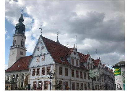
Rathaus und Fachwerkhaus in Celle

Nach der Besichtigung von 10:00 Uhr bis 11:00 Uhr mit zwei Klosterführer fahren wir nach Celle zur Mittagspause von 12:00 Uhr bis 14:00 Uhr. Das Beste hatten wir uns bis zum Ende unserer Reise aufbewahrt. Unsere Stadtführerin führte uns durch die „schönste Stadt Deutschlands“. Einen Teil der über 500 restaurierten und denkmalgeschützten Fachwerkhäuser, sahen wir bei einer 1 ½-stündigen Führung. Die restliche Zeit, bis zur Rückfahrt zum Hotel, um 18:00 Uhr stand wieder zur freien Verfügung. Ankunft im Hotel um 18:15 Uhr und Abendessen um 19:00 Uhr