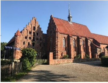
Im Kloster Wienhausen