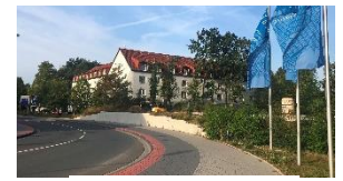
Hotel Tryp in Celle

Hildesheim. Die Bauwerke auf dem historischen Marktplatz, sowie die faszinierenden UNESCO Welterbe-Kirchen St. Michaelis und dem Dom St. Mariä Himmelfahrt belohnten die Besucher von 15:30 Uhr bis 16:30 Uhr mit faszinierender Atmosphäre. Fahrt nach Celle zum Hotel Tryp. Ankunft 18:35 Uhr, Abendessen um 19:00 Uhr.