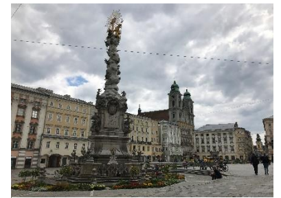
Hauptplatz in Linz

Die Heimfahrt führte vorbei Wels und Simbach, durch Umleitungen zurück über Burghausen zur Bundesstraße 12. Eine Einkehr im Gasthaus Isensee bei Winhöring beschloss die Reise. Ankunft in Ebersberg um 20:30 Uhr.