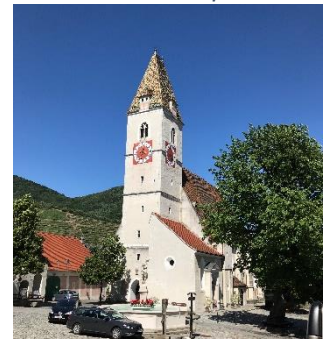
Kirche in Spitz